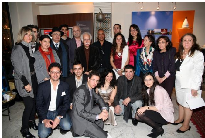
L'ensemble des artistes présents à la soirée culturelle en compagnie de l'équipe organisatrice.