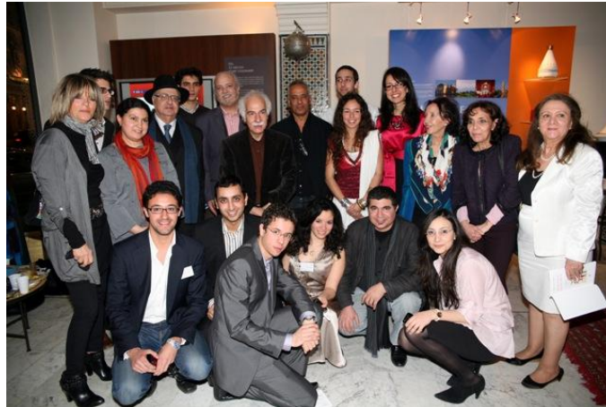
L'ensemble des artistes présents à la soirée culturelle en compagnie de l'équipe organisatrice.