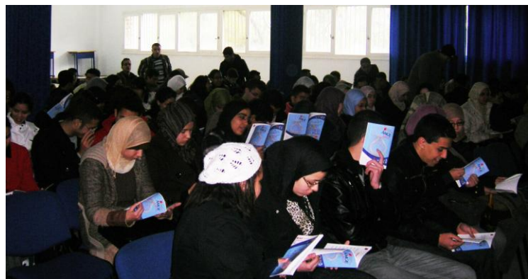
Présentation au Centre Pédagogique Régional (Tanger)