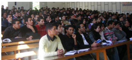
Présentation au Lycée Mohammed V de Casablanca

L'Opération a nécessité un travail en amont de coordination avec le Ministère de l'Éducation Nationale, afin de préparer notre passage dans les différents centres.