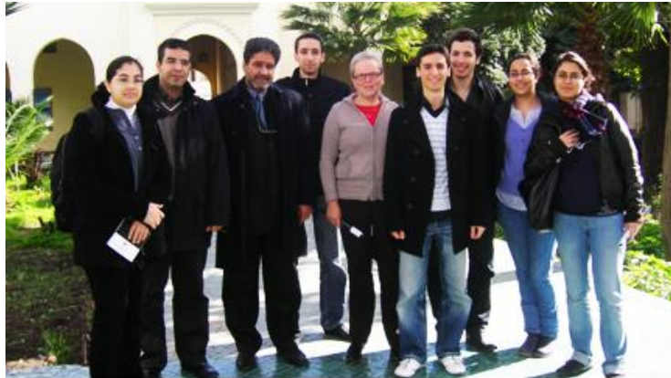
L'équipe de la Caravane 2010 en compagnie du Directeur et du Directeur d'Etudes du centre Moulay Idriss de Fès.