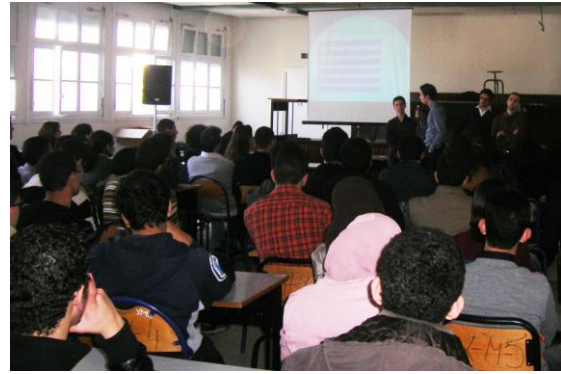
Présentation au Lycée Moulay Youssef de Rabat

En outre, un « Guide des Concours » a été préparé par les membres de l'AMGE-Caravane, puis distribué au niveau de toutes les classes préparatoires du Maroc. Ce guide regroupe toutes les informations nécessaires à la préparation des concours : modalités de visa et de bourse, présentation des épreuves et de leurs différentes spécificités, ainsi que les formations offertes dans chaque école.