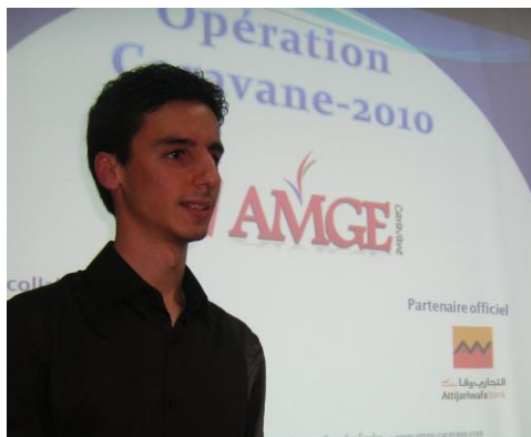
Présentation au Lycée Ibn Taimiya (Marrakech)

Il convient de noter que la totalité des 2700 préparationnaires marocains ont par ailleurs reçu le « Guide des Concours » conçu par l'AMGE-Caravane.